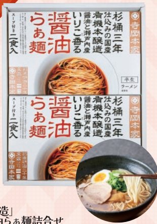
広島県 広島支店 ■「寺岡有機醸造」 寺岡本家醤油らぁ麺詰合せ