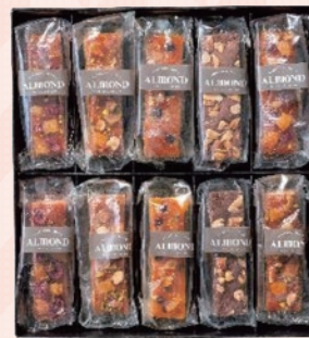
東京都 本社・西新宿オフィス・多摩営業所 ■六本木アマンド 〈六本木ケイクパトン〉