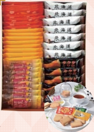
北海道 札幌支店 ■ガレットセット