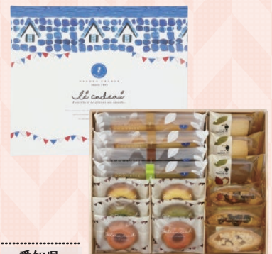
愛知県 名古屋支店 ■名古屋フランス ル・キャドー