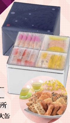
新潟県 新潟営業所 ■越後抄 大缶