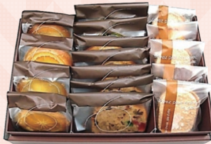
大阪府 大阪本店 ■「サロン・ド・ガトー・アンジュ」 焼き菓子アソートセット