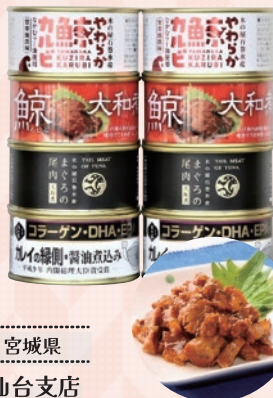
宮城県 仙台支店 ■宮城「木の屋石巻水産」 バラエティ缶詰8缶セット