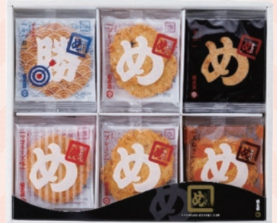
福岡県 福岡支店 ■めんべいギフト 彩り