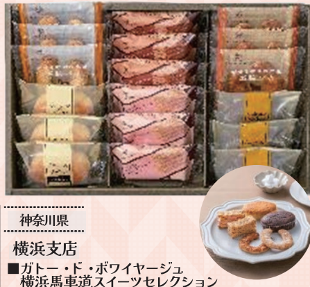
神奈川県 横浜支店 ■ガトー・ド・ボワイヤージュ 横浜馬車道スイーツセレクション