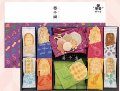
埼玉県 北関東支店 ■草加葵 葵千楽