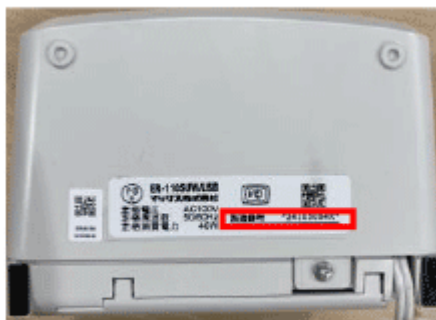
製造番号（本体底面）